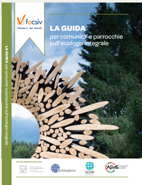
La Guida per comunità e parrocchie sull'Ecologia Integrale 2020 – FOCSIV

Per partecipare è richiesta l'iscrizione e il versamento di una quota di partecipazione di 30€ come impegno di presenza e relativo minimo sostegno ai costi del corso. Ai partecipanti oltre alle lezioni e alla interazione con i relatori verranno forniti materiali come registrazioni, slide e documenti e, su richiesta, un attestato di partecipazione. Per ogni modulo di formazione i Media Partner indicheranno ai partecipanti alcuni testi come suggerimento per l'approfondimento e Avvenire fornirà l'accesso gratuito al quotidiano on line.